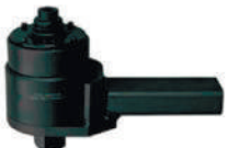
TN40 с реакционной опорой