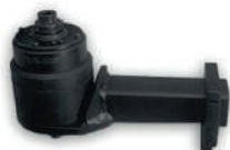
TN60 с перемещаемым реакционным упором