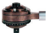
TN14 с реакционной рукояткой